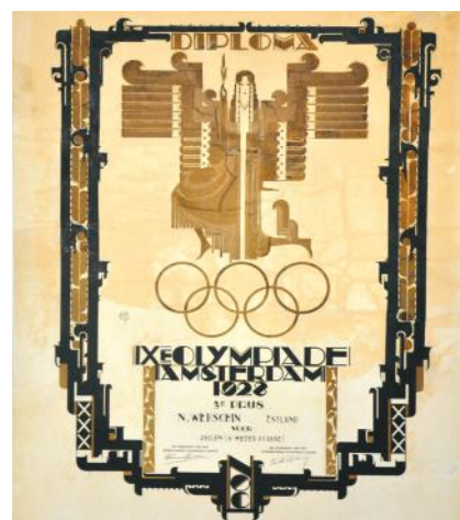
Команда Эстонии на Олимпиаде 1928 г. Диплом за третье место