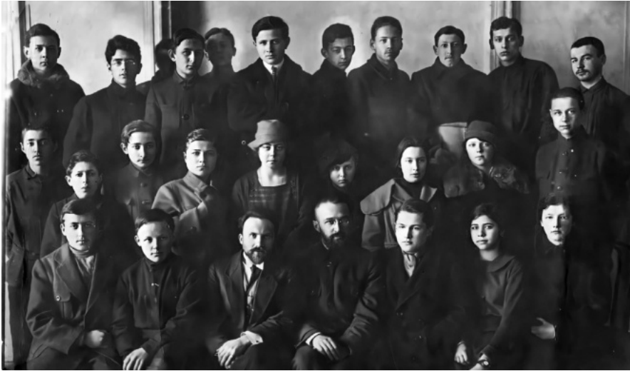
Фотография класса, в котором учился Д. Лихачёв. 1923.