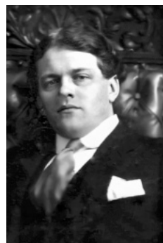
Николай Владимирович Поликарпов